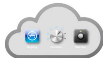
システムマネージャ MDM