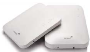
Meraki MR ワイヤレスLAN