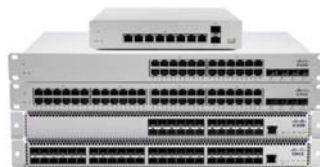
Meraki MS ギガビットスイッチ