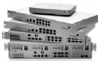
Meraki MX セキュリティプライアンス