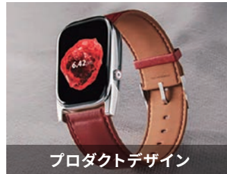
プロダクトデザイン