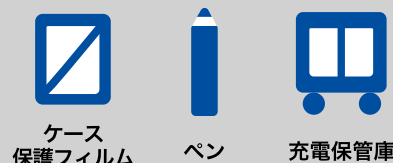
ケース 保護フィルム